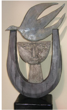
Ephrem le Syrien (306-373)

Toi qui scrutes les profondeurs de Dieu, Toi qui illumines les yeux de notre cœur, Toi qui Te joins à notre esprit, Toi, par qui nous réfléchissons la gloire du Seigneur, Nous te magnifions.